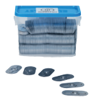
Plaquettes de fixation Code article : E6560 Conditionnement : 1Bte (500 Pces)