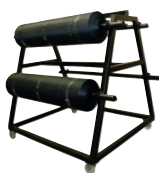
Avec un dérouleur vous pouvez facilement gérer les rouleaux EPDM et les couper sur mesure.