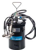
Cuve à pression Code article : E513 Conditionnement : 1Pce